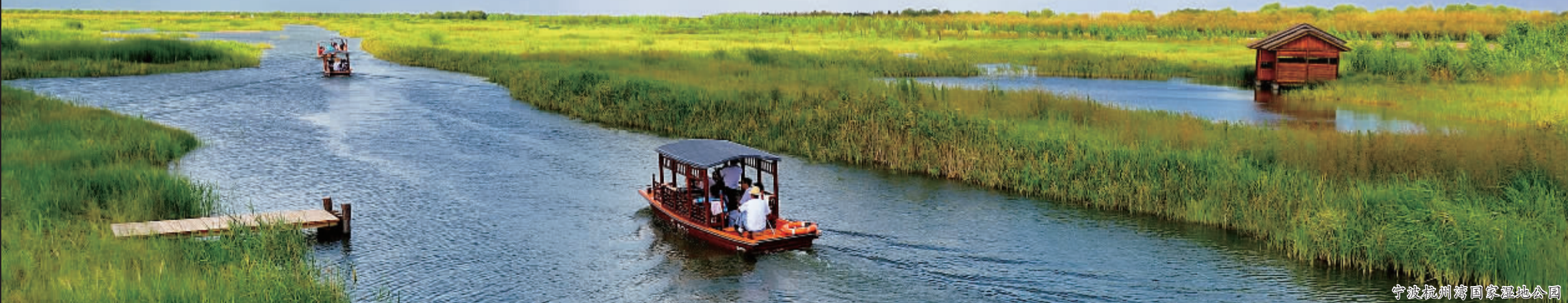
宁波杭州湾国家湿地公园