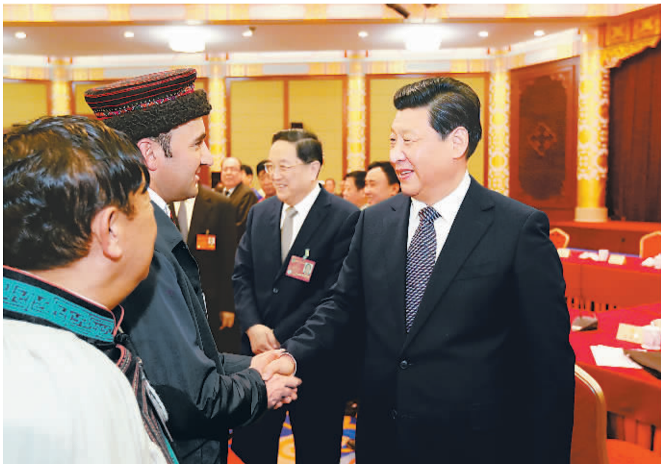
右图 3月4日,中共中央总书记、国家主席、中央军委主席习近平看望出席全国政协十二届二次会议的少数民族界委员,并参加联组讨论。中共中央政治局常委、全国政协主席俞正声参加了看望和讨论。