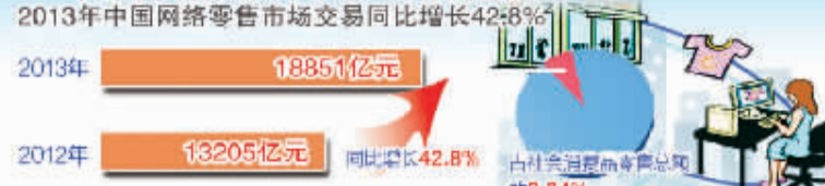
中国电子商务研究中心3月4日发布数据显示