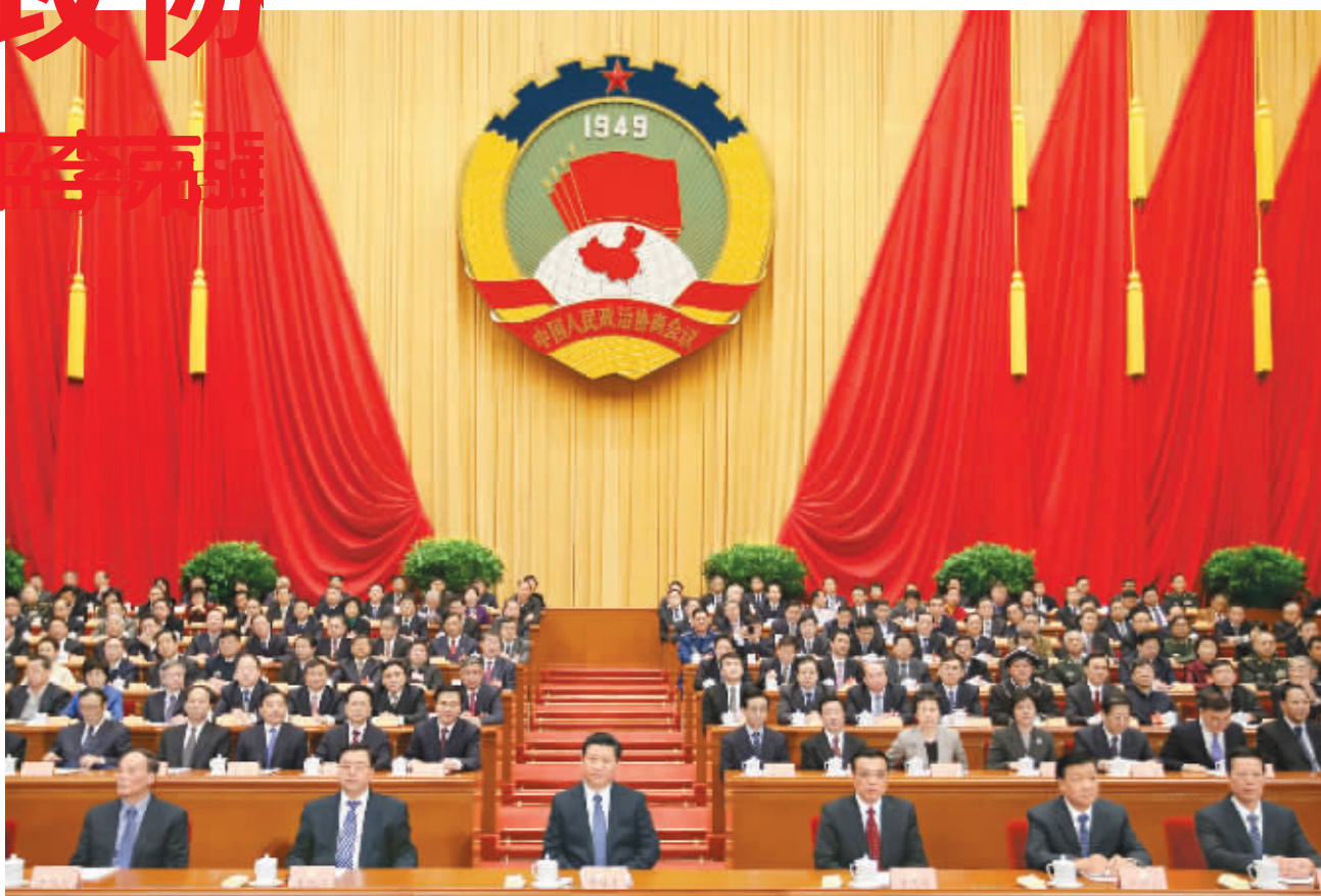
3月3日,中国人民政治协商会议第十二届全国委员会第二次会议在北京人民大会堂开幕。这是习近平、李克强、张德江、刘云山、王岐山、张高丽在主席台就座。

韩启德作主 新华社北京3月3日电 协商议政共绘改革宏图,凝心聚力开创伟业。中国人民政治协商会议第十二届全国委员会第二次会议3日上午在人民大会堂开幕。今后9天里,2000多位政协委员将履行政治协商、民主监督、参政议政职能,积极建言献策,为全面深化改革凝聚共识,为实现中华民族伟大复兴的中国梦汇聚力量。