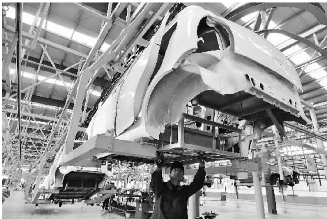
2月28日,山东维动新能源汽车有限公司工人在生产车间装配电动汽车。该公司是一家技术创新型企业,通过科技创新对生产的电动汽车时速、爬坡能力、启动平滑度、电池续航里程等进行优化,克服制约电动汽车生产和销售的诸多瓶颈,逐渐打开市场,受到用户青睐。

本报讯 记者李予阳报道:国家电网公司日前作出2014年履责承诺,电网投资将超过3800亿元。其中,智能电网建设改造投资超过750亿元,配电网建设改造投资超过1500亿元,投入研究与开发经费70亿元。