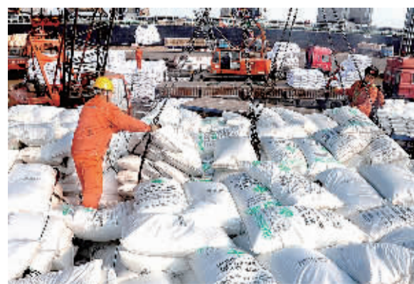
2月23日,码头工人在连云港港口码头吊装转运刚从货轮上卸下的春耕化肥。眼下已进入春耕时节,江苏连云港港口设立农用物资专用绿色通道,实施24小时预约,对春耕化肥实行快速验放。