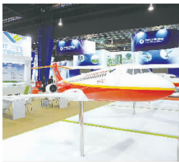
新加坡航展上,中国商飞展示的ARJ21支线飞机的模型。