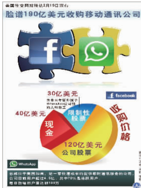
脸谱位于美国加州,是一家快速发展的软件和服务公司,公司目前用户超过4.9亿,其中70%是活跃用户,每日新增用户高达100万。

萨尔茨堡塞尼黑银行是一家位于慕尼黑并专注于为中小企业和私人客户提供服务的小型银行,由赖夫艾森银行集团全资拥有。目前,该项交易仍有待相关监管部门的批准,德国联邦金融监管局和德国联邦卡特尔局将对所有权控制程序进行审查。