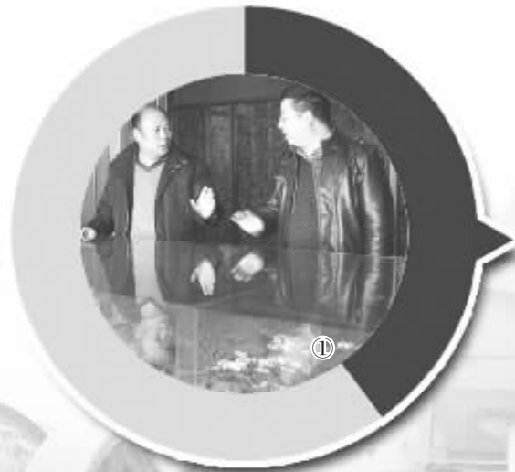
①宜安镇工作人员向企业家介绍王屋装备制造产业园的规划布局。 底图为被拆除后的鹿泉市汇源建材有限公司现场。

通过两次集中拆除，石家庄市将减少水泥产能1850万吨，约占全市总产能的40%。比原定计划提前3年完成“淘汰水泥过剩产能1500万吨”的目标任务。