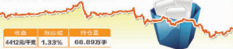
2月18日沪银1406合约走势图