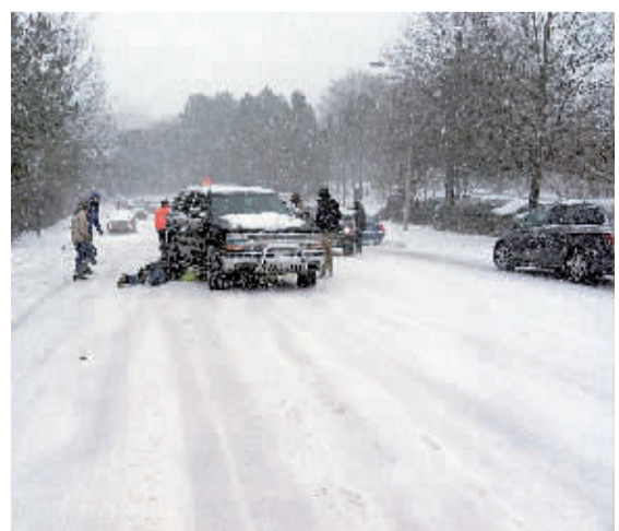
2月12日，在美国北卡罗莱那州达姆姆，人们在风雪中给打滑的车辆增加防滑。美国南部佐治亚州等地12日再度遭遇暴风雪天气考验，已造成数十万户家庭断电、上千架次航班被取消。

据报道，这份法案为印尼政府限制进出口提供了法律依据，政府可以“保护国内产业”为由限制进口，也可以“确保国内供应”为由限制出口。不过，一些印尼专家对该法案表示担忧。印尼巴查查兰大学经济学家迪迪克·阿纳斯说，政府可以依据该法案介入贸易的方方面面。若法案未说明政府何时可以介入，这将对商业环境产生负面影响。