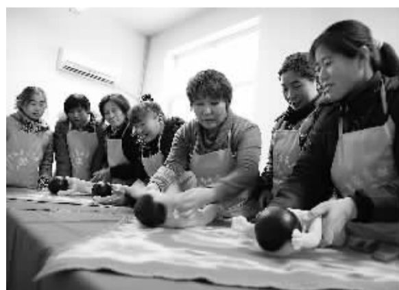
山东高青县农商行联合多部门举办了家庭技能培训,并推出下岗就业贷款、外来务工妇女小额担保贷款等金融特色产品,“贷”动全县家庭妇女走上创业就业之路。图为妇女们接受育儿技能培训。

同时,华夏“智慧电子银行”还实现了“智慧客服”。记者体验了一下其中的“智慧导航”。在电话接通95577后,选择智能语音系统,无需按键,只需“说”出需要办理的业务名称,就可以直接进入最终交易节点办理业务。据了解,这一客服服务还能够帮助客户通过电话,购买理财产品、办理银证第三方转账等。