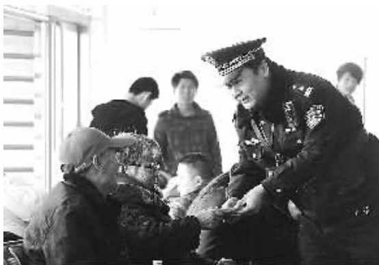
春运客流迎来返程高峰,山西临汾市铁路公安严厉打击各类违法犯罪活动。图为运城站客运民警向旅客讲解如何识别真假火车票。