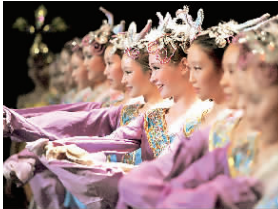
2月10日,北师大实验中学艺术团的小演员在法国枫丹白露表演舞蹈《紫箫吟曲》。当日,中法建交50周年——北京师范大学附属实验中学专场演出在法国著名旅游胜地枫丹白露举行。

空客与亚洲国家进行的环保型航空替代燃料合作始于中国。早在2012年,空客就与清华大学和中国石化等单位开展合作,推动航空替代燃料在中国的规模化生产和商业化进程。(郭际)