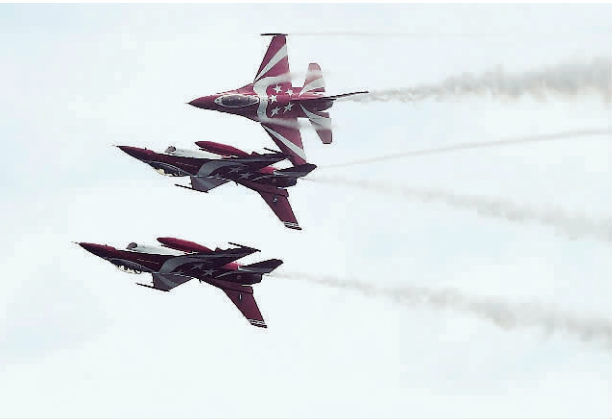
2月11日,在新加坡樟宜展览中心,新加坡空军“黑骑士”特技飞行表演队在新加坡航空展上表演。当日,为期6天的新加坡航空展在新加坡樟宜展览中心开展。

去年10月、11月美国非农就业岗位增幅均突破20万个,正是在就业状况有所改善的背景下,美联储去年12月18日决定逐渐退出量化宽松政策。而最近两个月非农就业岗位增幅仅为11.3万个、7.5万个,以及去年12月的劳动参与率降至62.8%,接近35年来最低水平等数据表明,美国就业市场仍未能实现大幅好转,这不仅将拖累美国消费增长,使人们对美国经济加快复苏的预估蒙上阴影。同时,也对美国货币和财政政策的制定与实施形成制约,更使美联储新任主席耶伦在如何把握退出量化宽松政策力度与节奏、如何与市场有效沟通等方面面临更大的考验。这些因素的综合效应将会影响市场的信心及美国经济的增长,而“经济增长”则是“增加就业”的最有效手段,如何实现“经济增长”和“增加就业”的相互促进,仍然有待观察。