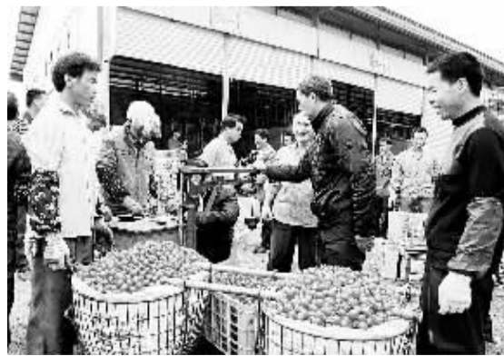
2月7日,在广西百色田阳县农副产品综合批发市场内,客商将购买的小番茄过秤。春节长假刚刚结束,我国南菜北运基地——广西百色市田阳县的秋冬菜就进入上市高峰期。