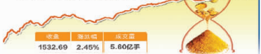
2月7日创业板指数成功站上1500点