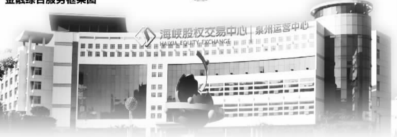
高利贷、非法集资、地下钱庄等非法金融活动,保障金融机构的合法权益,确保金融改革的可持续推进并取得预期效果。