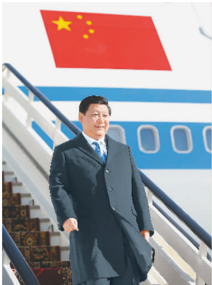
2月6日,国家主席习近平抵达俄罗斯索契,将出席第二十二届冬季奥林匹克运动会开幕式。

两国元首共同对中俄关系发展作出战略规划 习近平代表中国政府和中国人民祝索契冬奥会取得成功