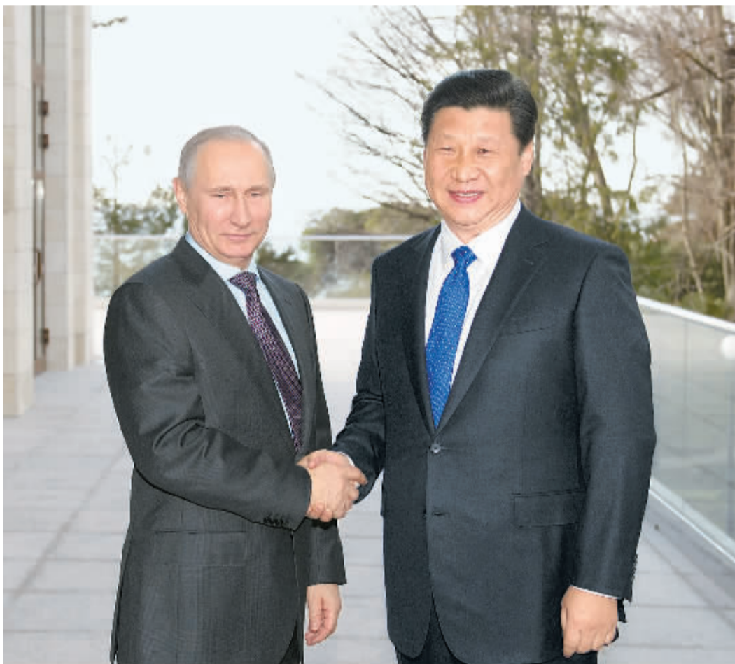
2月6日,国家主席习近平在俄罗斯索契会见俄罗斯总统普京。