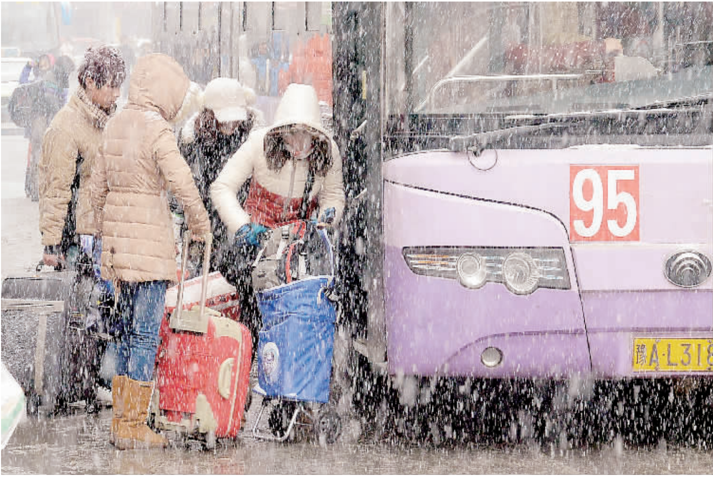
2月5日,在郑州长途汽车站外,旅客冒雪登上一辆公共汽车。当日,郑州市出现降雪,给聚集在郑州火车站和长途汽车站前广场上的返程旅客带来了不便。当地铁路和公路运输部门尽力采取措施,确保旅客安全、顺利地踏上归程。

邊樹鵬35歲,2001年從太原理工大學陽泉煤專畢業後來到官地礦綜采三隊參加工作。現在他每天開着小汽車上班,工作生活很滋潤。官地礦長宋建軍告訴記者,去年他們全礦采煤420萬噸,沒發生一起生產死亡事故。一塊下井的西山煤電集團公司董事長薛道成自豪地講,他們已經連續3年穩產5000萬噸煤炭,並創下了百萬噸零死亡率的紀錄。