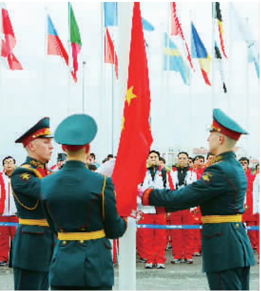
2月5日,中国代表团在升旗仪式上。当日,中国体育代表团在2014年索契冬奥会海滨奥运村举行升旗仪式。

在河北石家庄市,一处处闲置的工厂厂房、学校教室被分割成“格子间”,挂上了“创业孵化基地”的牌子;银行承诺创业小额贷款10个工作日内办结……全民创业的热潮,在这个城市激荡涌动。2013年,石家庄每天平均诞生50家公司,全年新增个体工商户、私营企业、农民专业合作社等市场主体6.7万个,民营经济实现增加值3032亿元,预计对地区生产总值的贡献度达到62%。