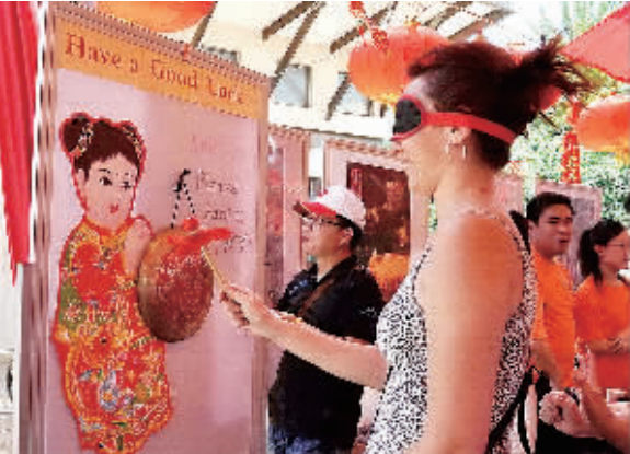
图为一名蒙眼的南非妇女正在敲响马年幸运锣。

1月29日,祖马总统发表新年献辞。祝愿中国人民以及生活在南非和世界各地的华侨华人马年吉祥,南中关系在新的一年里更上新台阶。1月30日,南非30万华侨华人家家户户看“春晚”节目,吃团圆饭,在祥和喜庆的氛围中度过除夕之夜。南非华人过春节的活动一直持续到正月十五元宵节。这期间,侨社团体将举办春节团拜晚会,唐人街2月8日将举办一年一度的万人大拜年和烟火晚会。届时,唐人街将上演舞龙舞狮和东北二人转,同时街道两侧将摆放500桌酒席,一次可供5000人吃年夜饭,从下午到晚上吃年夜饭的人将达到万人。不过,要想吃到万人大拜年的酒席,需要提前1个月预订。你更不会想到,70%的酒席是南非当地各民族民众预订的。由此可见,中国年正走进南非民众的生活。