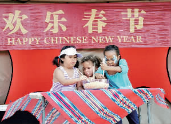
图为春节庙会上,三名不同肤色的南非儿童在比赛筷子夹大米,看谁夹得多。