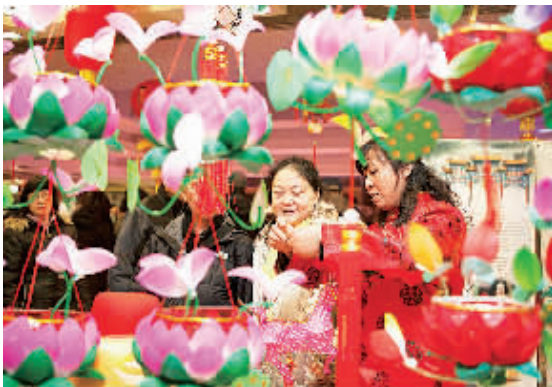
1月30日,在加拿大多伦多,观众参观秦淮灯艺展示作品。当日,来自中国南京的“欢乐春节——中国南京文化周”访问团来到加拿大多伦多,带来极具中国民俗文化特色的南京剪纸、秦淮灯艺等作品展示或表演。