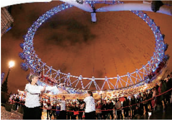
1月30日,几名外国武术爱好者在英国“伦敦眼”前表演中国武术。当晚,英国伦敦泰晤士河畔的“伦敦眼”亮起彩灯,庆祝中国春节的到来。