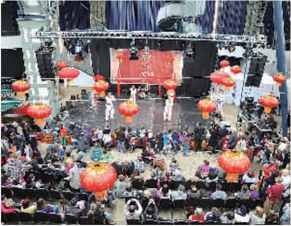
2月2日,近万名旅匈华人和布达佩斯市民踏着积雪参加由匈中文化艺术交流中心主办的“欢乐春节”艺术节。