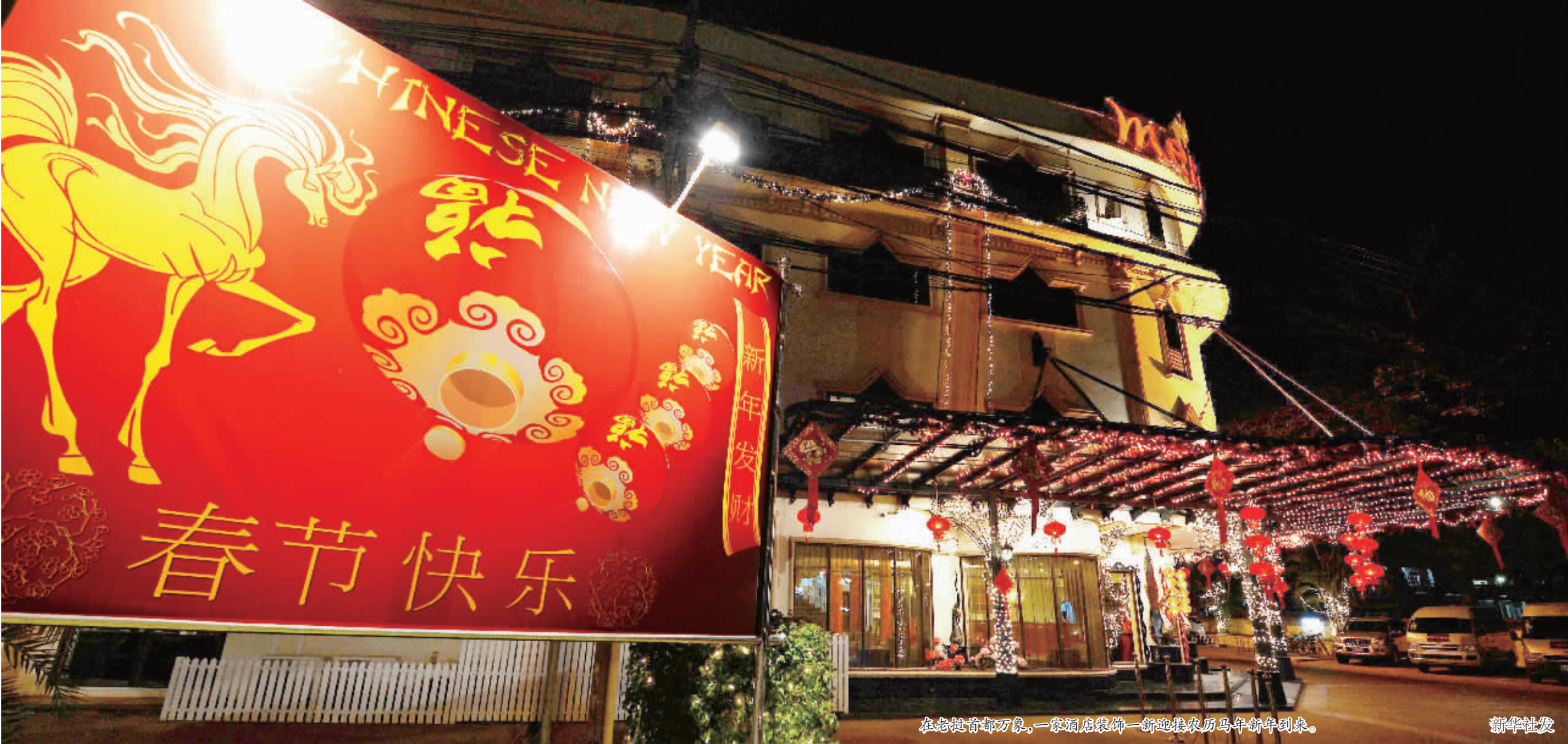
在老挝首都万象,一家酒店装饰一新迎接农历马年新年到来。