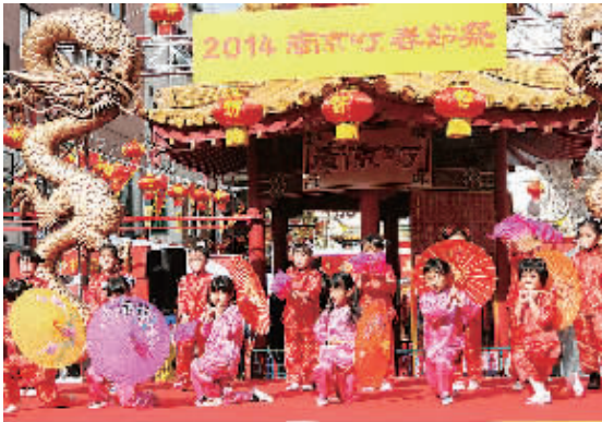
1月31日,日本神户华侨幼儿园的小朋友在南京街表演舞蹈。当日,为期3天的“春节祭”在拥有120多年历史的神户南京街拉开帷幕,吸引诸多游人前来品尝中国美食,并欣赏富有浓郁中国特色的表演。