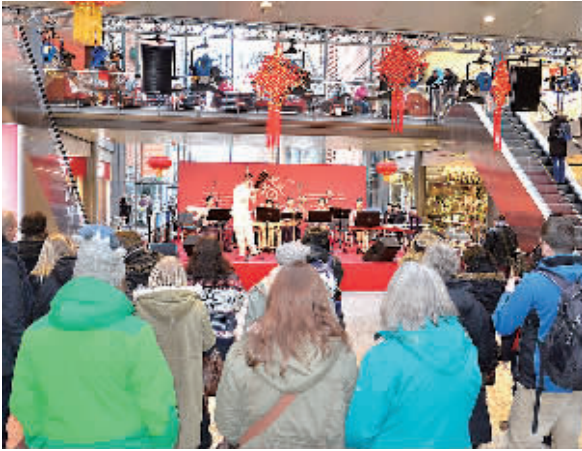
图为柏林波茨坦广场Arkaden购物中心的春节音乐会引得众多德国民众驻足观看。

此外,中国的春节庆祝活动还走进柏林大型商场,与德国民众交流和互动,让更多德国人了解中国文化。欧洲大陆最大的百货大楼卡迪威里,“年味”十足的橱窗里陈列着的茶具、竹制工艺品和招财猫等中国商品,中国红装饰墙上大大的“福”字和折纸画等中国元素,吸引着德国顾客的眼球。