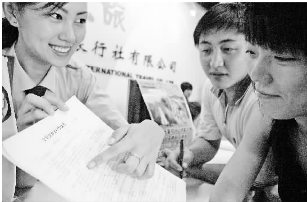
一家旅行社在报名出团前增加了签署文明旅游协议书内容。