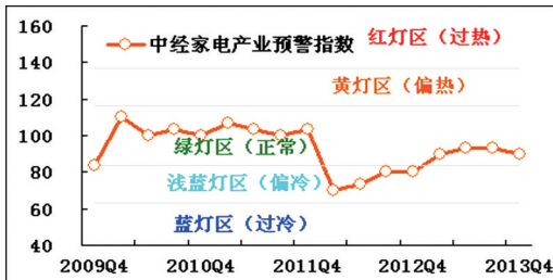
中经家电产业预警灯号图