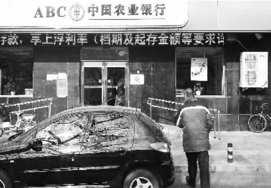
2013年12月21日至2014年3月20日,中国农业银行定期存款利率上浮至10%。在农行北京地区营业网点,相关公告每天都在滚动提示。

浮期从去年12月21日到今年3月20日,结束后存款利率将调回,建行从今年年初开始,目前没有发布结束时间。