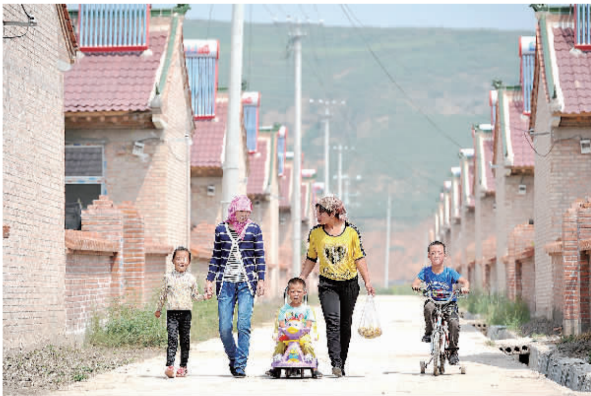
在宁夏回族自治区泾源县兴盛乡新旗村,当地村民带着孩子从村里新建的小道上走过(2013年8月22日摄)。

从2013年开始,地处宁夏西海固地区的泾源县开展了以整乡推进为核心内容的扶贫开发新模式,民生进一步改善。