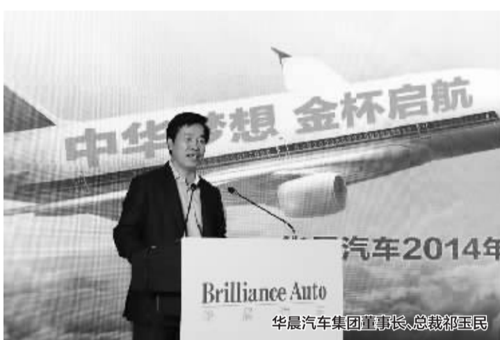
华晨汽车集团董事长、总裁祁玉民

华晨汽车旗下的另一品牌——金杯,经过多年发展和引进国外先进技术,已连续17年稳居轻客销量首位,得到了超百万用户的信赖与支