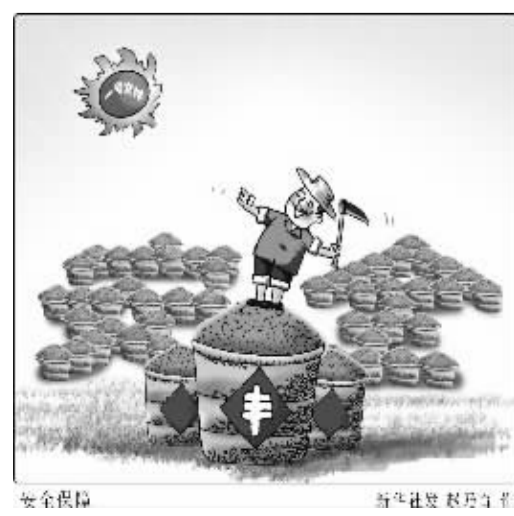
安全保障

新年伊始,中央一号文件印发,再次吹响了全面深化农村改革的集结号,打响了加快推进农业现代化的发令枪。新一轮农村改革,针对的病根是城乡二元结构体制,瞄准的目标是健全城乡一体化发展体制机制,把握的要义是城乡统筹联动,赋予农民更多财产权利,让农民平等参与现代化进程、共同分享现代化成果。