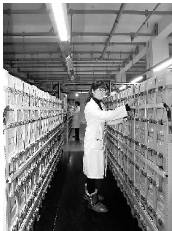
图为中国电信云计算内蒙古信息园高频UPS系统。从2012年开始,内蒙古自治区着手布局云计算产业。截至目前,全区已建成运营服务器16.5万台,建成了目前亚洲最大的数据中心基地。内蒙古最早建成的中国电信云计算内蒙古信息园已于2013年7月开园,并安装服务器12.1万台。

数据显示,2013年,中国造船三大指标市场份额继续保持世界领先,造船完工量、新接订单量、手持订单量分别占世界总量的41.4%、47.9%和45.0%,其中新接订单量比2012年提高了4.3个百分点。