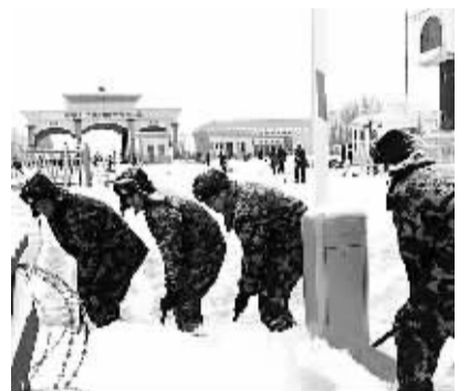
连日来,新疆吉木乃口岸气温持续在零下40摄氏度左右,道路冻滑严重影响了40余辆出口企业的货车通行。吉木乃边检站立即启动“跨国救助绿色通道”,提供延时通关服务。图为边检官兵正在清扫界桥积雪。