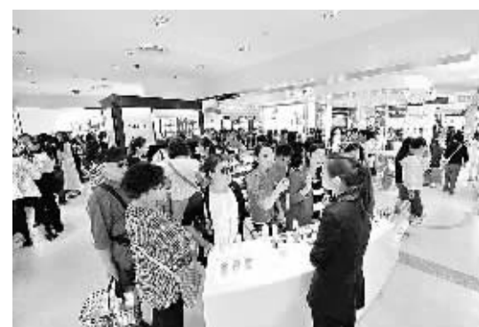
1月15日，游客在海南三亚市内免税店购物。2013年海南离岛免税购买人数突破110万人次，实现销售金额约33亿元。