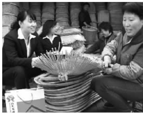
1月14日,山东无棣农村合作银行工作人员来无棣县李八里村了解柳编工艺品生产经营情况和资金需求。该县近年来给予创业女性金融、技术等支持,目前共有7000多名妇女搞起了畜禽养殖、蔬菜种植等业务。

数据显示,截至2013年底,国开行“四台一会”的模式在湖南省共搭建了16个中小企业统贷平台,与28个担保平台开展业务合作,业务范围覆盖湖南省14个地市,共为4000家中小微企业提供了融资支持,贷款回收率达100%。其中为华昌棉麻有限公司、力宇纺织原料有限公司、龙腾纺织品(集团)有限公司等6家棉花生产加工企业贷款4300万元,增加就业岗位2000余个,受益棉农达5800户。