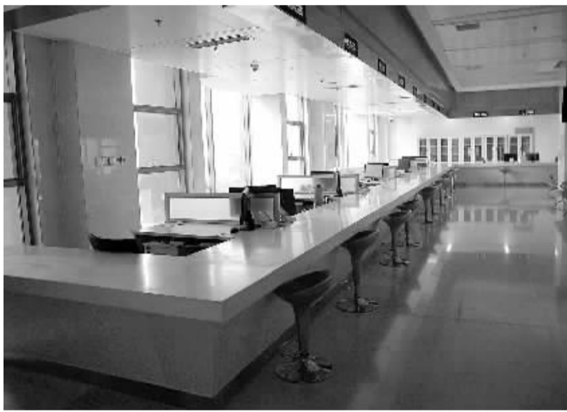
1月14日上午8点45分,廊坊市安次区行政服务中心内,部分职能部门窗口空无一人。

编者按 岁末年初,是百姓集中办理登记注册、医疗、社保、就业、养老、出行及各种事务的时间段,那些以“便民”为宗旨的行政服务大厅、便民服务中心等是否真的便民?本报派出记者对一些地方开展体验式暗访。今天刊出的是记者在河北省廊坊市部分职能窗口的体验。