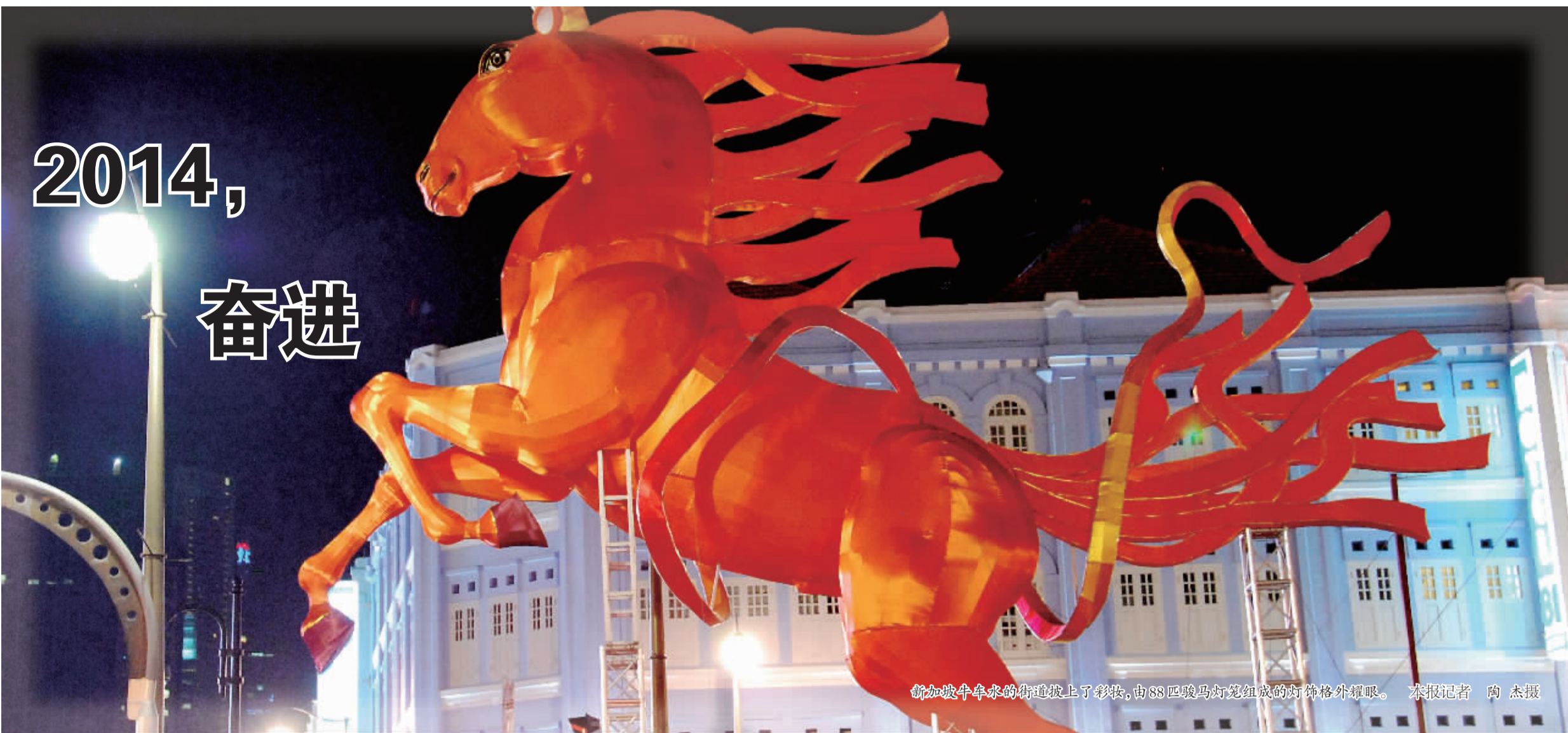
新加坡牛车的街道披上了彩妆,由88匹骏马灯笼组成的灯饰格外耀眼。