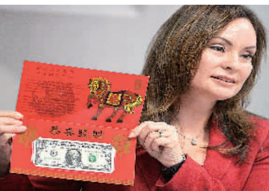
2013年12月3日,在美国首都华盛顿,美国财政部官员罗茜·里奥斯展示农历马年限量版一美元“吉利钱”。

洪平凡指出,世界要加强国际政策协调,减轻量化宽松政策退出带来的国际溢出效应。主要发达国家的中央银行是国际储备货币的发行者,他们对全球经济的流动性和稳定性责无旁贷,应该向其他国家阐明他们的政策立场和退出方案。