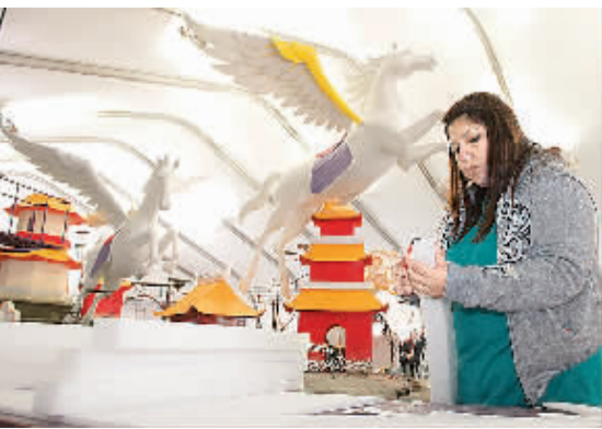
2014年美国帕萨迪纳玫瑰花车游行将有一辆中国花车亮相。图为在美国洛杉矶,一名工人正在制作花车配饰。