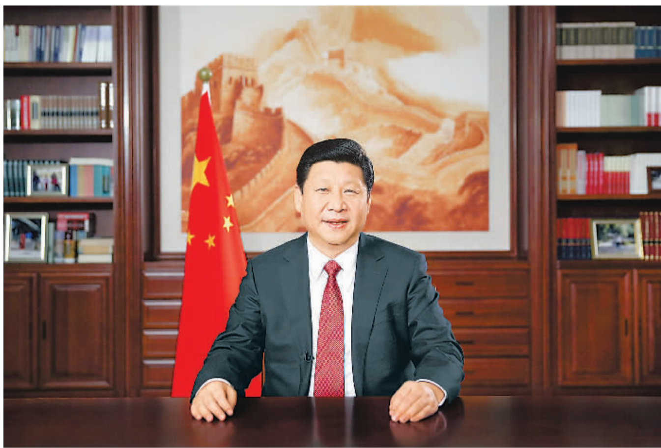
新年前夕，国家主席习近平通过中国国际广播电台、中央人民广播电台、中央电视台发表二〇一四年新年贺词。

新华社北京12月31日电 新年前夕，国家主席习近平通过中国国际广播电台、中央人民广播电台、中央电视台，发表了二〇一四年新年贺词。全文如下：