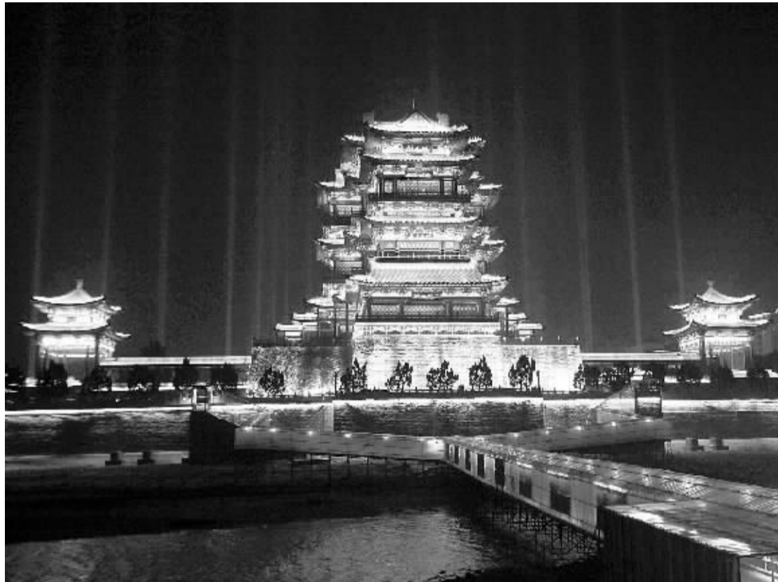
12月26日晚,长达8公里的南昌“两江两岸”景观照明提升改造工程正式完工,120余种光色在赣江两岸打造出梦幻“动态画卷”,成为这座千年古城旅游观光的新亮点。

续梅透露,这次考试招生制度改革将是系统性、综合性最强的一次改革。当前教育改革已步入深水区,教育领域的问题不仅是教育问题,还与社会问题交织,必须通过综合改革推进。