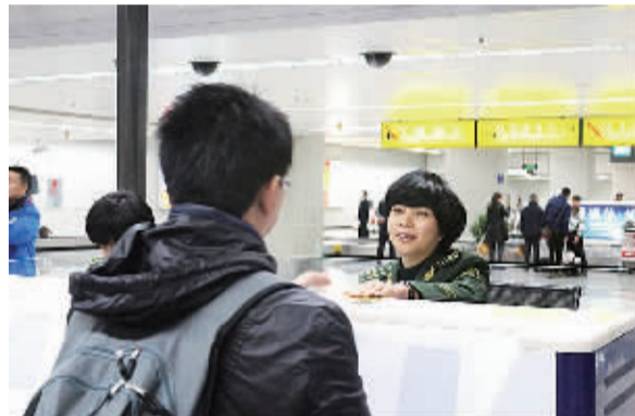
12月18日，福州至台湾空中直航航线开通满5周年。5年间，两地航班由初期每周两架次增至50架次，经此航线往来两地的旅客达130万人次。图为福建边防总队福州机场边检站干警为直航旅客办理通关手续。

莆田供电公司的项目经理针对客户在办理业扩流程过程中经验不足和物资、技术等方面不专业的特点，定期上门为客户提供咨询并提出专业建议，尽心为客户提供更优质的服务。今年以来，该公司已为企业代办28个业扩项目，完成送电11个项目，且都在客户要求的时间内提前30天以上完成。(潘明林鹏)