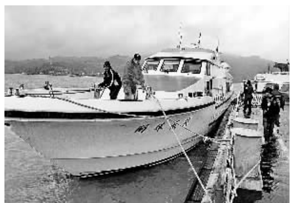
12月15日,“两马”航线客轮闽珠2号抵达福州马尾港客运码头。自2008年12月15日两岸实现全面“三通”五年来,闽台两岸海空直航航线累计运送旅客达1042万人次。

据介绍,从目前侦破的案件情况看,涉网假药犯罪主要呈现以下特点:不法分子有的在新闻门户网站、搜索引擎,以及各种医药、化工、招商、保健咨询等专业网站上投放非法药品广告,招徕业务,引诱患者上当受骗;有的开设网站、网店,复制、拷贝专业医药信息,伪装成正规的医疗机构,或以“代购”、“厂家直销”等面目出现,蒙蔽欺骗群众。