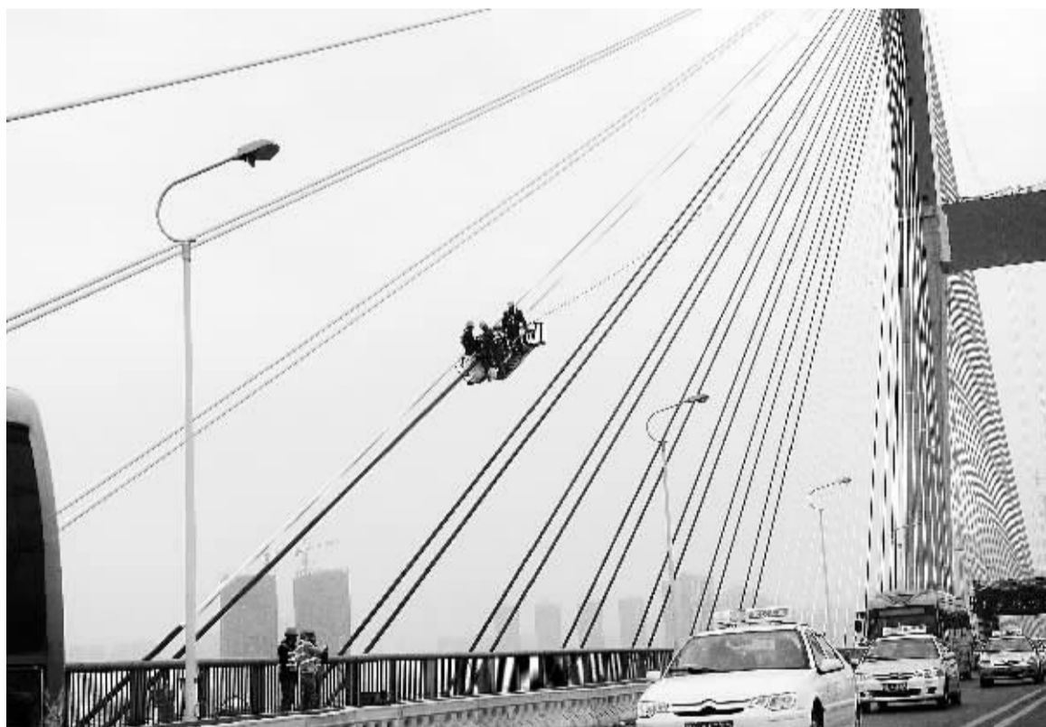
施工人员在为武汉长江二桥的斜拉索更换新的PVE缠包带。

循环利用体系初步建立,资源产出率、单位建设用地生产总值、万元工业增加值用水量、农业灌溉水有效利用系数、城镇(乡)生活污水处埋率、生活垃圾无害化处理率等处于全国或本省(市)前列,城镇供水水源全面达标,森林、草原、湖泊、湿地等面积逐步增加、质量逐步提高,水土流失和沙化、荒漠化、石漠化土地面积明显减少,耕地质量稳步提高,物种得到有效保护,覆盖全社会的生态文化体系基本建立,绿色生活方式普遍推行,最严格的耕地保护制度、水资源管理制度、环境保护制度得到有效落实,生态文明制度建设取得重大突破。