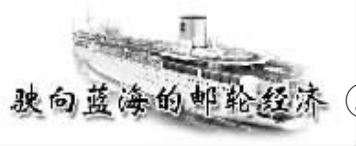
驶向蓝海的邮轮经济 ③

文化产业“以人为本”。多年来,中心以“文化资源与文化产业”为依托,培养了一批文理交叉的创新型人才,奠定了中心在全国一流的“文化与科技融合创新研究中心”的重要地位。