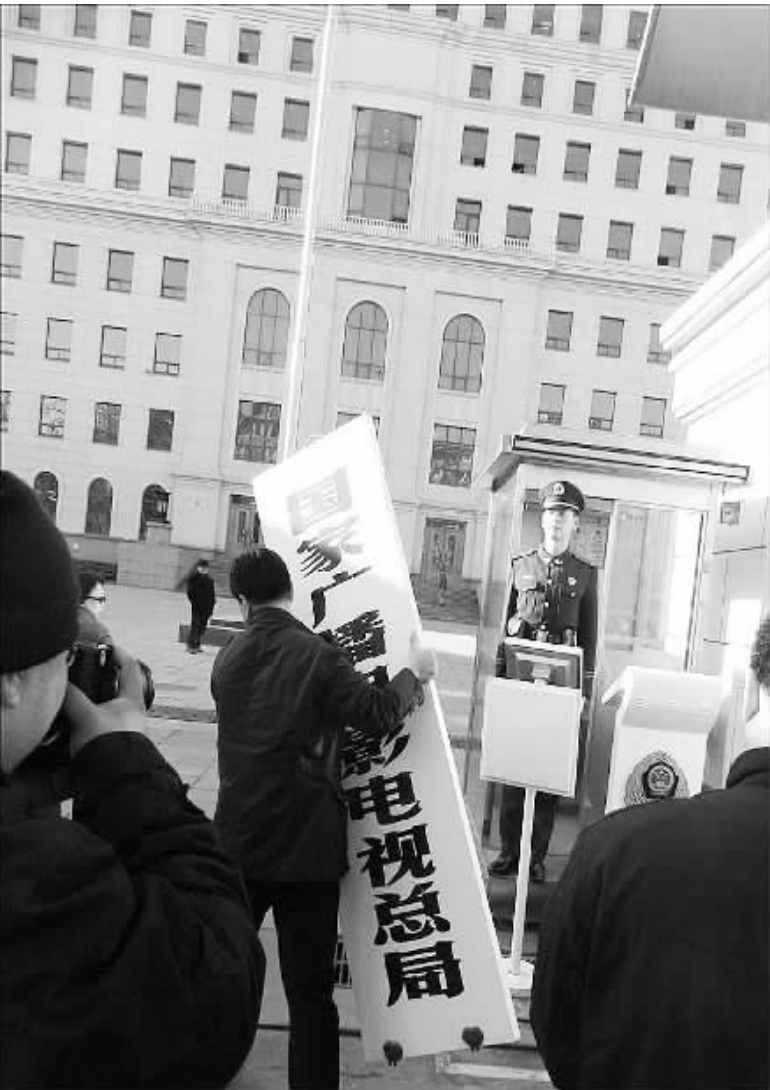
今年3月22日，国家广电总局摘去旧牌，国家新闻出版广电总局正式挂牌。

编者按 2013年即将过去,我们再次来到回顾的时点。这一年,从年初深入贯彻落实党的十八大精神,到年末认真落实党的十八届三中全会对文化体制改革作出的一项重要部署,我国的文化产业和文化事业的发展取得了令人瞩目的成绩。