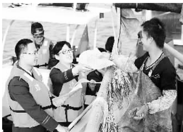
12月4日，全国法制宣传日到来之际，深圳边防支队组织官兵成立法制宣传小分队，纷纷深入辖区企业、广场及辖区海域开展法律法规知识宣传，确保辖区安全稳定。图为支队官兵向渔民派发法律宣传单。

本报讯 记者从最高人民检察院获悉：今年1至10月，全国检察机关共办理各类民事行政检察监督案件109526件，同比上升42.6%，共有13501件民事行政申诉案件当事人息诉。 最高人民检察院民事行政检察厅主要负责人告诉记者，面对群众反映突出的“申诉难、监督难”，民事行政检察部门结合贯彻执行修改后民法，采取一系列举措解决问题，取得了明显成效。 畅通“入口”，让符合申请监督条件的案件都能够进入检察监督视野，是解决群众申诉难的首要环节。在刚刚颁布的《人民检察院民事诉讼监督规则(试行)》中，设专章规定了受理当事人监督申请的条件和程序，明确了当事人可以向检察机关申请监督的案件类型；列举了当事人申请监督时需要提交的材料内容，便于当事人准备相关材料；明确了受理案件的检察院，方便当事人就近申请监督；明确了检察机关受理当事人申请监督的条件和不予受理的情形，并规定凡符合受理条件的，检察机关都应当受理。 记者了解到，为方便群众申请检察监督，各级检察机关专门设置了民事行政检察接待窗口，接收和处理人民群众的民事行政监督申请，提高了群众来信来访的受理处理效率。(高健)