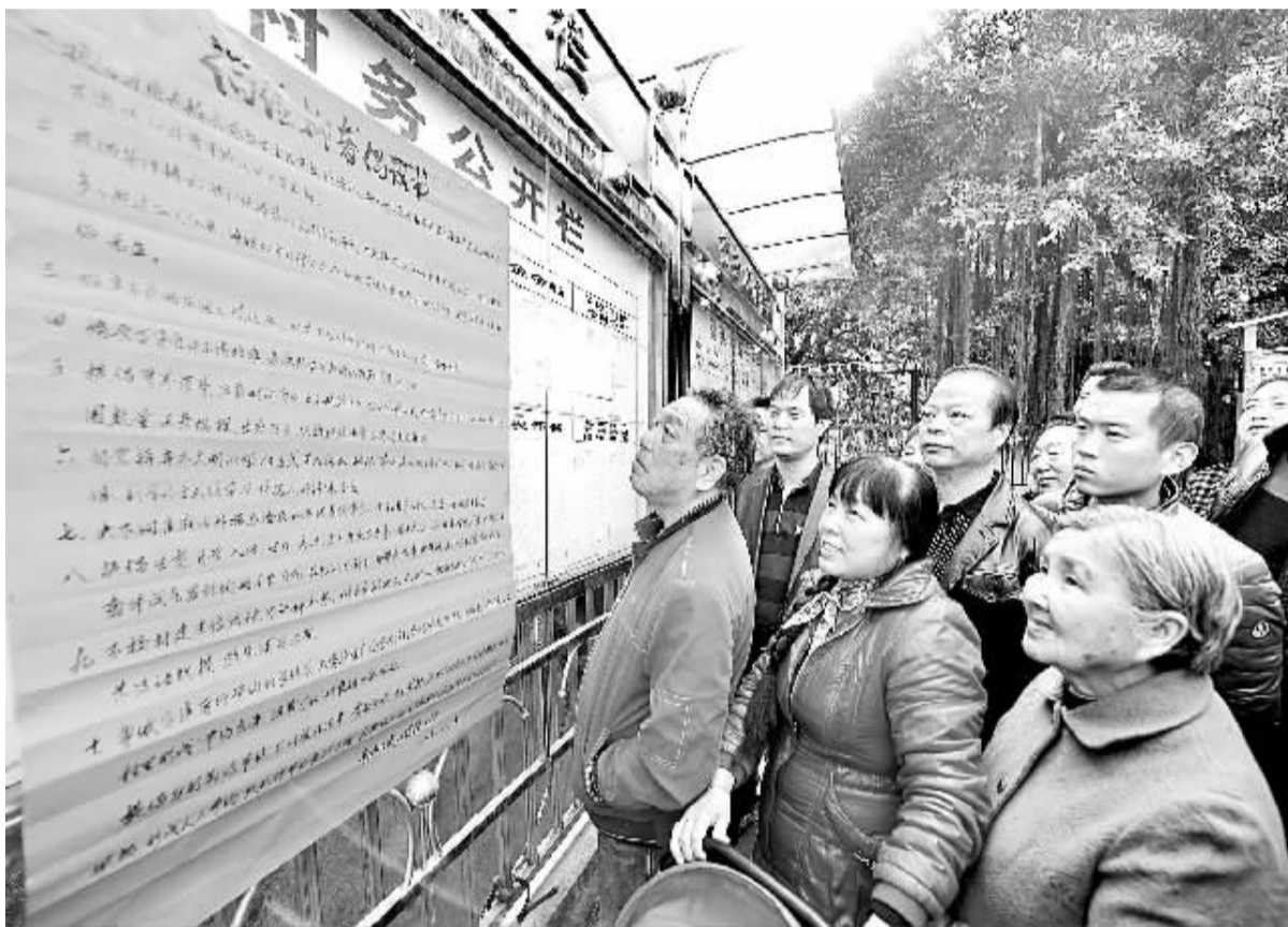
12月4日，福建省福州市仓山区城门镇璧头村村民在观看“倡俭抑奢”倡议书。该村党员干部郑重向村民承诺：移风易俗，厉行勤俭节约、反对铺张浪费，自觉接受广大村民的监督。