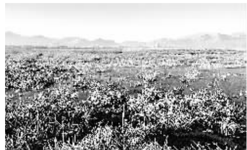
西藏拉萨市规划投资约7亿元用以保护“拉萨之肺”——拉鲁湿地国家级自然保护区。拉鲁湿地国家级自然保护区是国内最大的城市湿地自然保护区,也是世界上海拔最高、面积最大的城市天然湿地。

当前要把生态文明建设向纵深推进,急需转变观念,要正确处理经济发展同生态环境保护的关系,牢固树立保护生态环境就是保护生产力、改善生态环境就是发展生产力的理念。