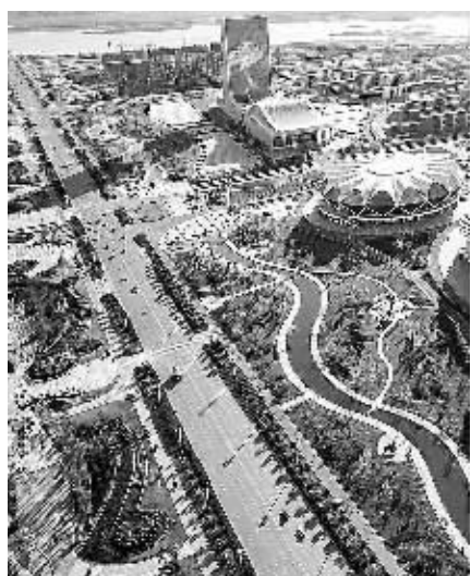
迁安规划了面积65平方公里的滦河文化旅游产业区,已入驻迁安龙湾游艇俱乐部、梅墨生艺术馆等12家文化企业。图为龙形云形绿化带。

“城有水则灵,滦河是迁安的母亲河,也是迁安的财富河,如何充分利用滦河的先天气势?”迁安决定再次抓住滦河综合治理的机遇做足城市发展文章。2010年按照“沿河布局、跨河发展、转型提升、城市扩容”的思路,迁安将中心城