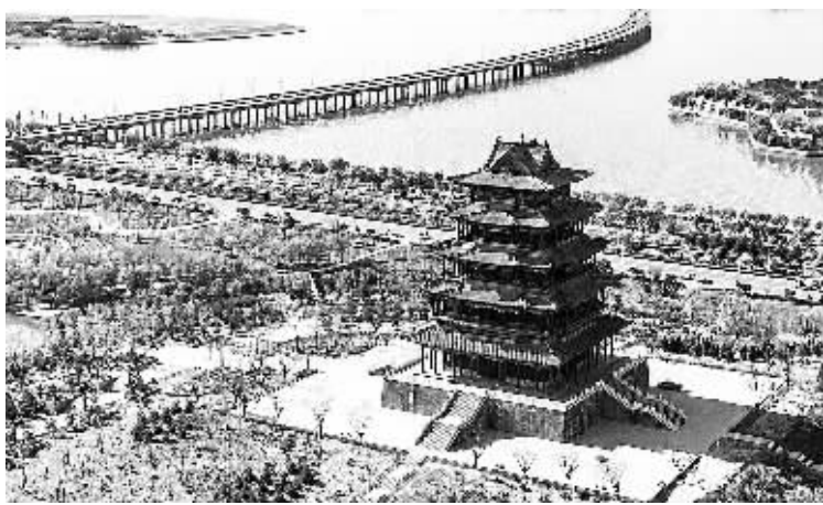
迁安以滦河生态景观为核心,将中心城区规划为“一河两区两城”。图为轩辕阁。

两年多来,迁安聘请国际国内名家大院进行规划设计,累计制定了60多项规划,结合中长期目标,高起点发展,把城市转型的战略思路全部落实到空间布局 and 具体项目上,各功能区各司其职,城市的承载能力大大增强,为迁安产业结构调整和城市转型奠定了基础。