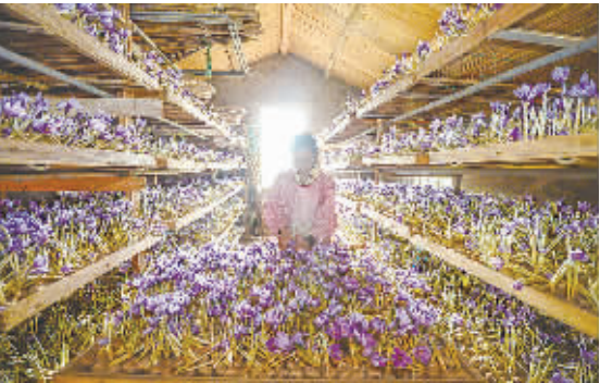
11月22日，舟山市朱家尖街道的藏红花种植户在采摘花朵。今年，朱家尖西红花专业合作社预计可实现收入200万元左右。