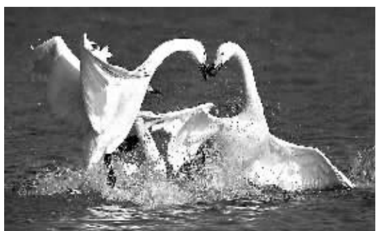
今冬以来,已有数千只白天鹅陆续从西伯利亚飞临山西省平陆黄河湿地越冬。

本报讯 记者杜铭报道:由中国新闻社、《中国新闻周刊》主办,环保部支持的第九届中国·企业社会责任国际论坛暨2013最具责任感企业颁奖典礼,日前在北京举行。本届论坛以“责任之艰:恪守与突破”为主题。环境保护部总工程师万本大在论坛上表示,面对日益严峻的环境问题以及自下而上的民众环境诉求,企业社会责任成为重要内容。企业应及时披露环境信息,这是一项重要的社会责任,既有利于企业履行环境责任,也可保护社会环境,同时也是对投资者的保障。中国工商银行、中国石化、中国建筑、中国平安、中国民生银行、港华燃气集团、安利、百度、太阳雨等15家企业获得2013最具责任感企业奖项。