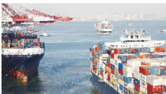
11月7日,青岛港集装箱码头一角。青岛港口吞吐量已居世界港口第七位。