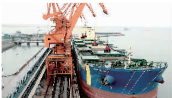
工人在辽宁丹东港码头进行吊装作业。丹东港年吞吐量已突破1亿吨。