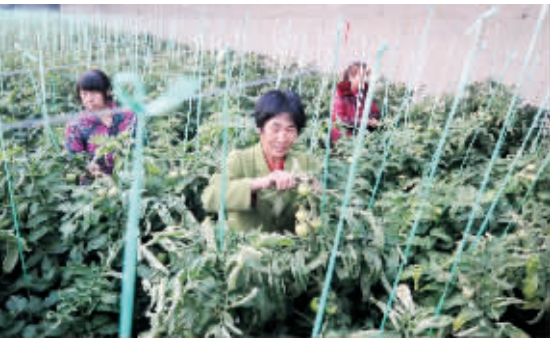
河北霸州京南桃园农业合作社工人在管理大棚里的西红柿。近年来，霸州市鼓励当地农民发展反季蔬菜种植供应京津市场，农民种植收入不断提高。

记者：《决定》明确提出，城乡二元结构是制约城乡发展一体化的主要障碍。您认为《决定》在破除城乡二元结构方面，有哪些理论创新和政策突破？