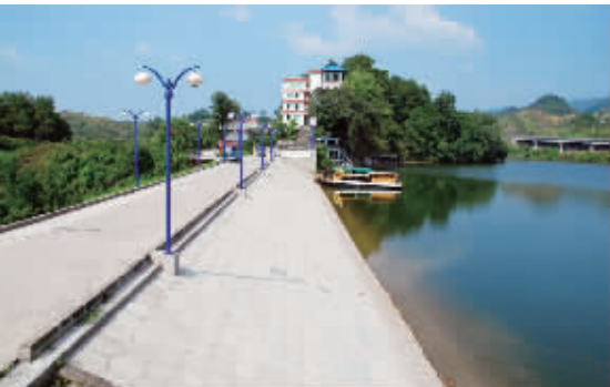
这是整治后的重庆市梁平沙坝水库坝堰。近年来，国家商品粮基地县梁平水务部门组织实施小型水库除险加固37座，有力促进了当地现代农业发展。

推进城乡要素平等交换，关键是要尊重农民的权益和财产权利，发挥市场在要素价格形成中的决定性作用，实现城乡各类要素之间的平等交换。而推进公共资源均衡配置，关键是要更好地发挥政府的作用，通过政府的宏观调控甚至是直接干预，来推动公共资源在城乡之间的均衡配置