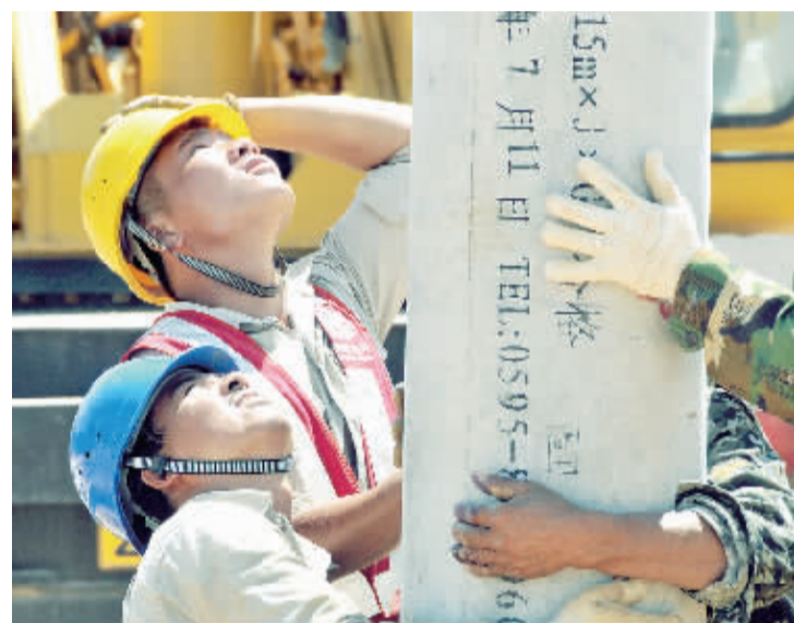
国家电网福建公司全力服务福建省工业园区建设。

2012年以来,福建省开始在街道乡镇推行消防安全网格化管理,通过打造网格综合信息服务管理平台,招聘政府专职消防员、网格管理员,在农村搭建火警联动平台,依托综治办、安监办成立消防办、工作站等手段,建立了一支2000多人、遍布全省的专职和兼职消防队伍,走出了一条适合基层消防工作发展的新路子。