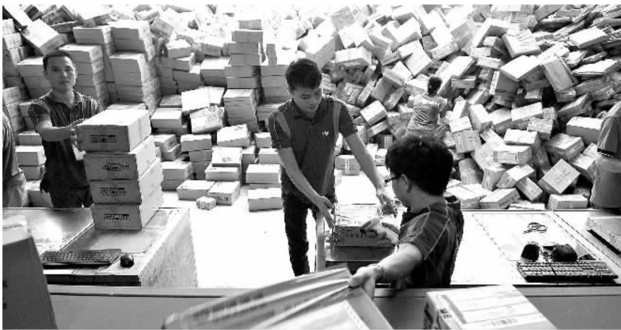
11月11日,在圆通公司广州一处分拣站,工作人员加紧扫描快件。