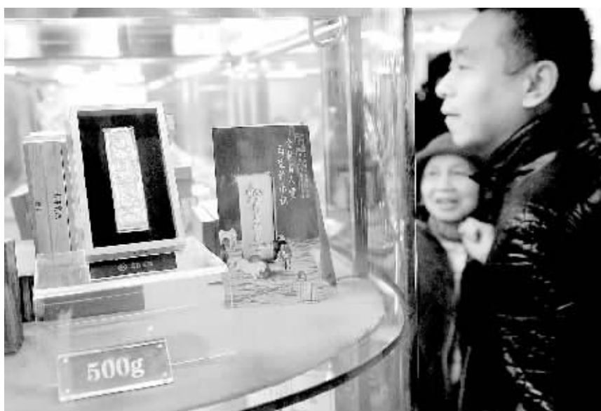
11月19日，消费者在北京某公司选购马年贺岁金条。当日，由中国金币总公司发行的2014甲午(马)年贺岁金条在京上市。