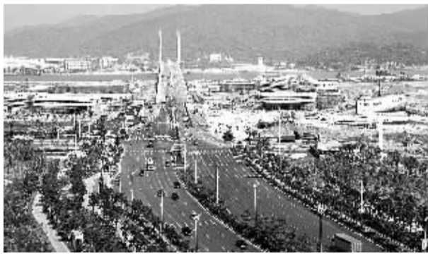
▲ 横琴新区二线通道。 ▲ 入住横琴“新家园”的村民早出晨练。 ▲ 粤澳合作中医药产业园展厅。