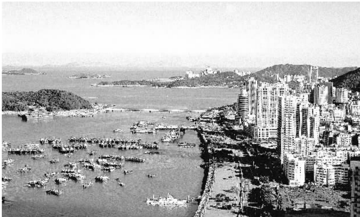
图为珠海市香洲区一景。本报记者 李茹萍摄