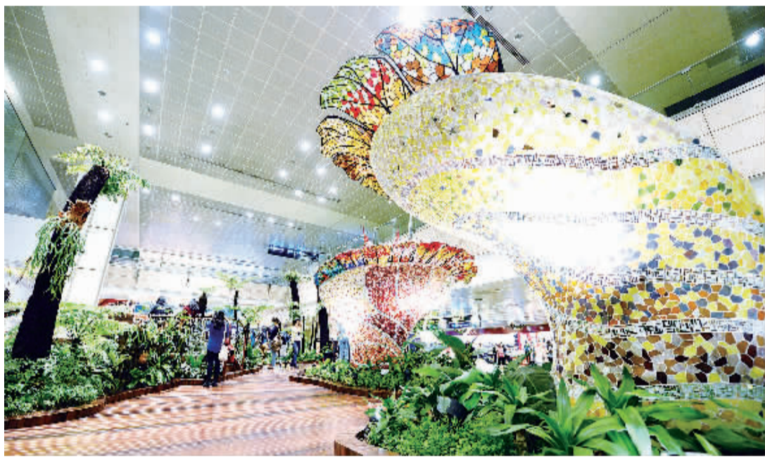
11月12日,新加坡樟宜机场内部装饰得美轮美奂。被誉为花园城市的新加坡,近期在樟宜国际机场推出“梦幻花园”主题园。

德国联邦统计局预计,明年德国消费支出增幅将由今年的1%升至1.3%,进口和出口增幅分别由今年1%和0.2%升至6.3%和5.2%。设备投资增幅由今年的-2.6%升至6.2%。通胀率由今年的1.5%升至1.9%。失业率由今年的6.9%降至6.8%。