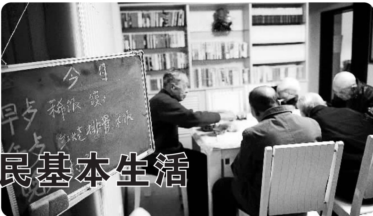
在青海省西宁市北川河东路社区老年日间照料中心内,几名“入托”老人在吃晚饭。