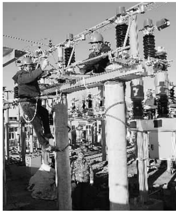
河北张北县供电公司抢抓农村电网改造“黄金季”,连日来积极组织电力职工对该县18个乡镇薄弱农村电网进行检修维护、升级改造。图为张北县黄盖滩变电站升级改造现场。