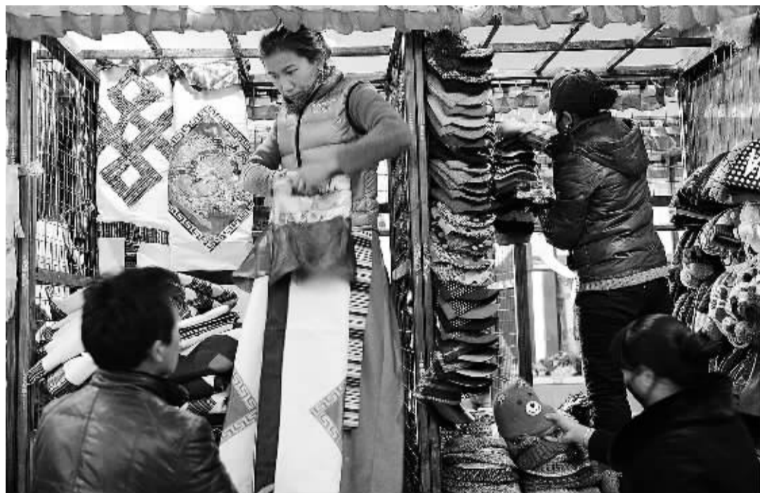
11月8日,刚刚搬进“八廓新城”的商户在布置摊位。

3000余摊位迁入八廓新城,使八廓街更加整洁、宽敞;同时减轻了老城区的人口负担,方便了老城区居民生活,改善了老城区城市面貌,有利于八廓街这一优秀传统文化遗产得到更加有效地保护。