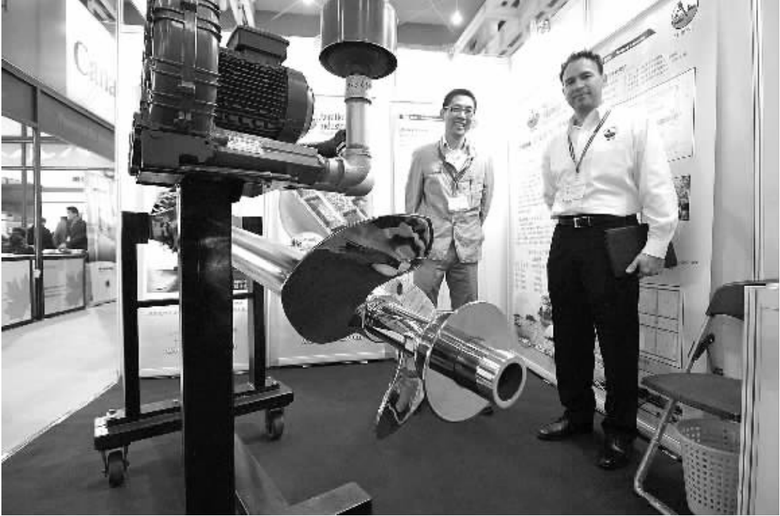
11月6日,观众在参观一套污水处理系统的水泵配件。

据介绍,该剧通过呈现近几年有特点的火警案例,将消防知识寓教于乐,致力于全民消防安全防范意识的普遍提升。(余 瓣)